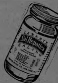
Un producto de Bristol-Myers Co.

SAL HEPATICA rápido...efervescente...eficaz.